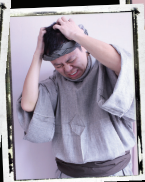
軟弱的彼得 (康樂飾)

在「來記念我」受苦節聚會中，我們將藉著音樂和七段角色獨白去重溫耶穌基督的生命，祂與人的相遇，並為成就救恩而經歷的痛苦。而在聚會的最後部份，我們會一同以聖餐記念主的愛，主的死。聚會有兒童節目，誠意邀請各位參加。