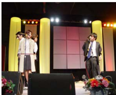
我們教會在年宵市場內的話劇表演

我們作為基督徒，除了要裝備好自己，更應該抓緊任何可以傳福音的機會，做好撒種的工作。希望明年在年宵的事工上能見到你的參與啦！