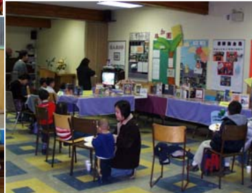
• 兒童圖書館開放日